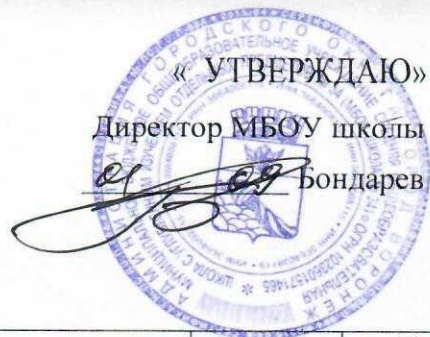
График питания 1 смена